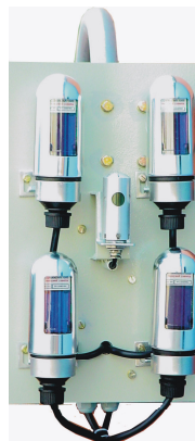
Sensor de luminosidad y fotocélulas de calibración

Ahorro obtenido: 150 horas anuales (más del 3%).